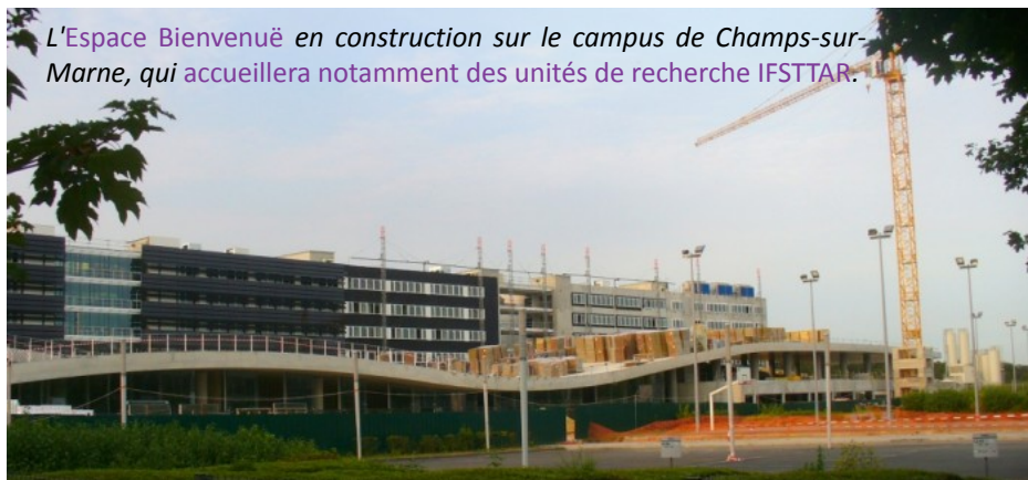
L'Espace Bienvenuë en construction sur le campus de Champs-sur-Marne, qui accueillera notamment des unités de recherche IFSTTAR.